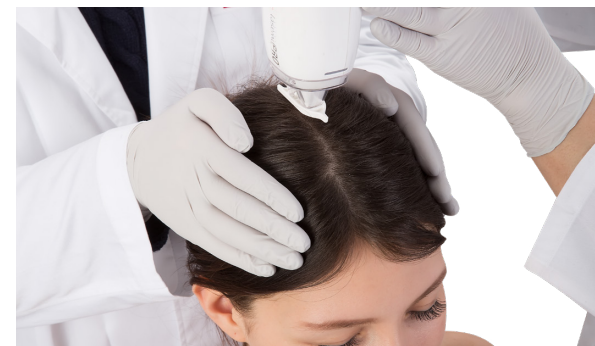
Ревитализация кожи головы для восстановления роста волос