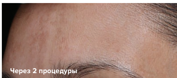
* На фото клинические результаты после процедуры только на аппарате LaseMD